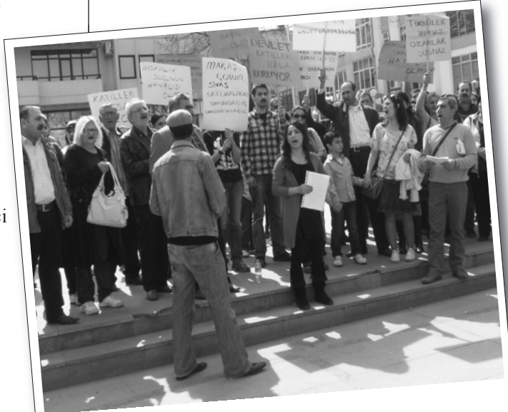
25 Mart 2012 | Çorlu