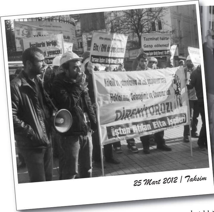
25 Mart 2012 | Taksim