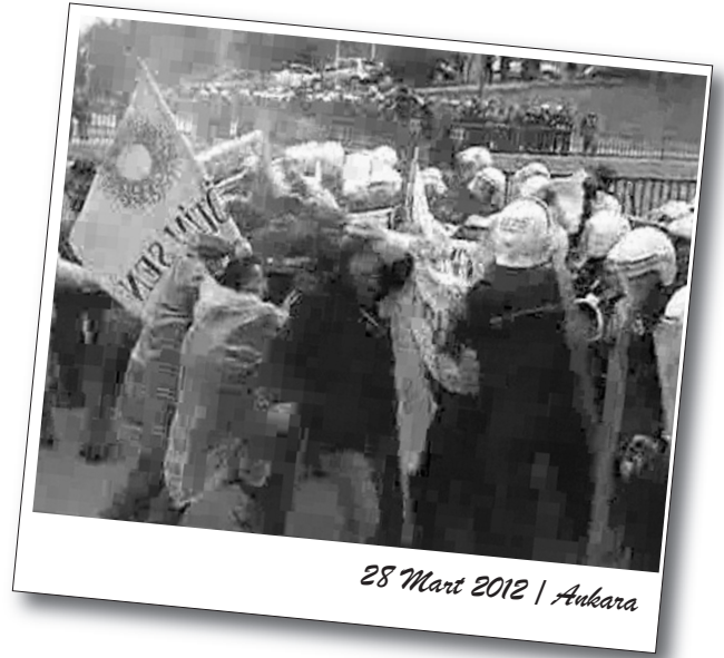
28 Mart 2012 | Ankara

Ankara'da GMK Bulvarı üzerinde sabahlayan emekçiler polis barikatıyla karşılaştılar. Gazetemiz yayına hazırlandığı sırada TBMM'de yasa tasarıları görüşülmeye devam ederken emekçilerin kararlılığı devam ediyordu.