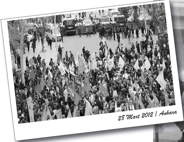
28 Mart 2012 | Ankara